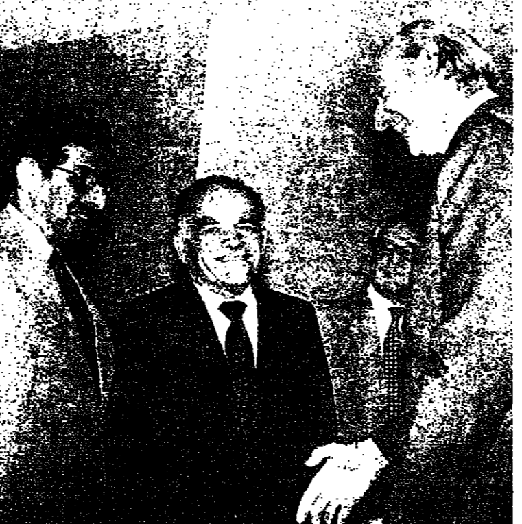
وزير الخارجية اسحق شيرون ومندوب اسرائيل الدائم لدى الامم المتحدة يهودا بلوم يزوران السكرتير العام للامم المتحدة كورت فالدهايم في مقر الامم المتحدة في نيويورك .

مباحثات تطبيع العلاقات بين اسرائيل ومصر تبدأ اليوم في العريش القدس - تبدأ في العريش اليوم المحادثات بين الوفد الاسرائيلي والوفد المصري للتصديق في تطبيع العلاقات بين الدولتين . وعلم ان الموضوع المركزي الذي سيثيره الوفد الاسرائيلي في هذه المحادثات هو اعطاء امكانية نقل بضائع بالطريق البري من اسرائيل الى مصر .